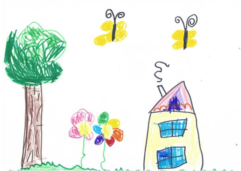
Avtor: Evelina Mulec

Otrokom je v javnem vrtcu zagotovljena možnost optimalnega razvoja ne glede na socialno in kulturno poreklo družine, veroizpoved in narodno pripadnost, ne glede na spol in telesno ter duševno konstitucijo. Upoštevamo zahtevo po enakih možnostih z upoštevanjem otrokovih pravic, tudi pravice do izbire in drugačnosti. Pri otrocih je to povezano predvsem z zahtevo po vzgoji za medsebojno razumevanje, strpno sožitje, odgovornostjo zase in za drugega. Javni vrtci so svetovno nazorsko odprti vsem otrokom, vsakega enako sprejemamo in spoštujemo.