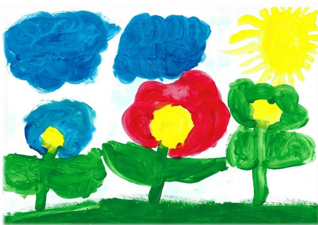
Avtor: Maša Ornik

Višina plačila se z odločbo določi kot odstotek, ki ga plačajo starši od cene programa, v katerega je otrok vključen. Starši plačajo največ 77 % cene programa.