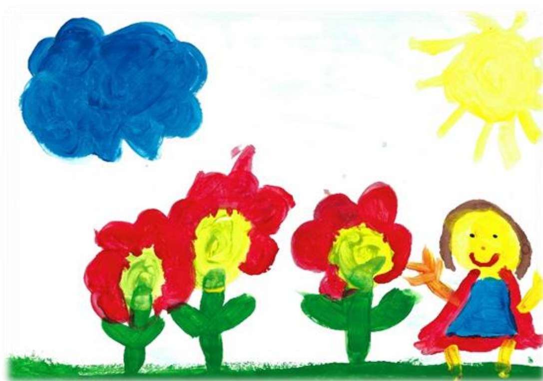
Avtor: Lucija Benko Rožman