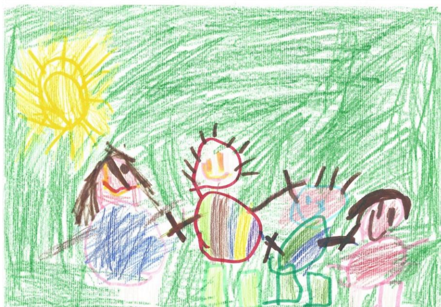
Avtor: Jaka Volf