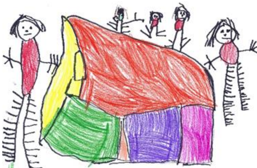
Avtor: Tisa Mauko

Za otroke, ki bodo vključeni v vrtec septembra, poteka uvajanje zadnji teden v avgustu. Otroci, ki bodo vključeni kasneje, se uvajajo en teden pred načrtovanim prihodom v vrtec. V tem času imajo starši pravico biti krajši čas skupaj z otrokom v vrtcu. Pri tem sledijo nasvetom vzgojiteljic glede njihove prisotnosti.